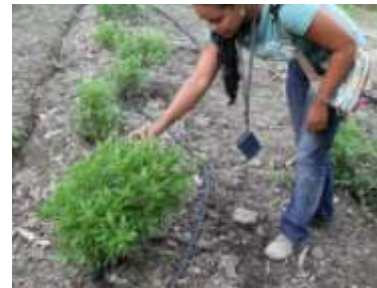
Seguimiento a proyecto de huerta de plantas medicinales

Diez y ocho (18) productores y una escuela con formación agropecuaria, recibieron asesorías directas; ocho (8) capacitaciones / talleres a nivel grupal se llevaron a cabo, para mostrar de manera práctica, las acciones en materia de agricultura ecológica.