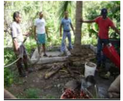
Seguimiento a proyecto de elaboración del compost, con comunidad capturadora de cangrejos