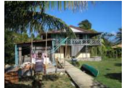
Antes y durante el proceso de adecuación de locaciones para la producción del aceite de coco de manera tradicional