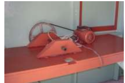
Los beneficiarios del proyecto desarrollaron todo el trabajo (mano de obra)