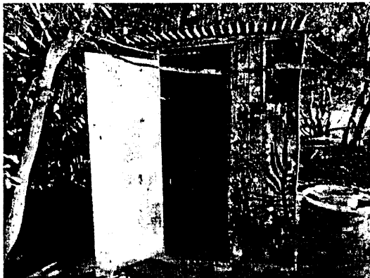
Figura 3. ALBER BAR&TOMCORNER, Baño

A los alrededores del lugar se registraron en total 60 árboles de seis especies incluyendo palmeras de cocos ( Cocos nucifera ), mancheoneel ( Hippomane mancinella ), mangle rojo ( Rhizophora mangle ), Tamarind ( Tamarindus indica ), Almond ( terminalia catappa ), Mangle botton( Conocarpus erecta )