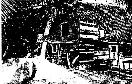
Figura 1. Albert & Tomcorner bar

También cuenta con un sitio de esparcimiento de 12 m 2 cuya estructura está hecha de arbustos, cubierta de una parte por zinc, y otra parte descubierta y cuenta con una silla de madera (figura 2).