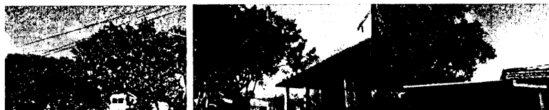
Características de los árboles

La razón de la solicitud de poda de los árboles expresado por el solicitante, es debido al riesgo por daños o interferencias que estos puedan causar a las redes eléctricas y a su vivienda.