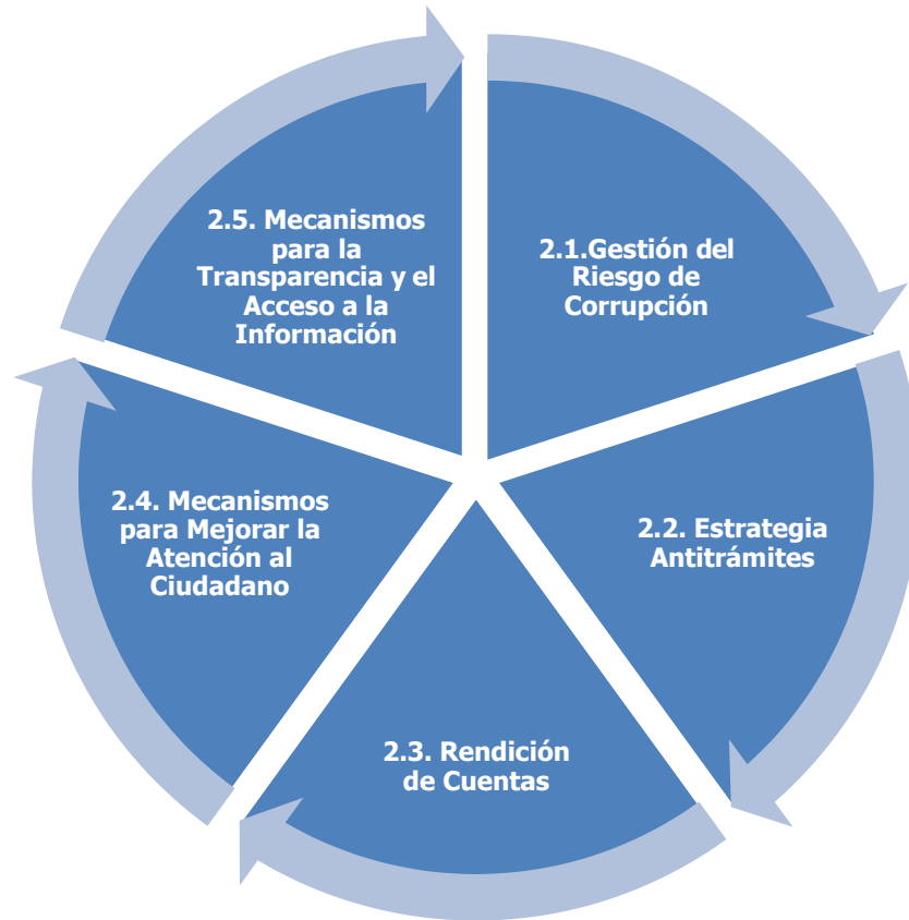
Grafica No. 1. Componentes del Plan Anticorrupción y atención al ciudadano. Fuente: Autores. Coralina 2020